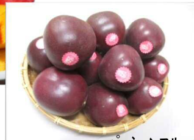
パッションフルーツ